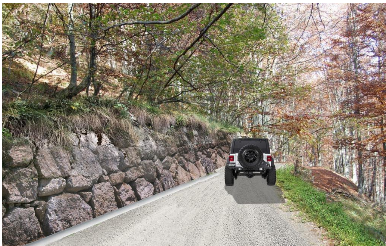
TIPOLOGIA DI UN TRATTO DI PISTA CON SCOGLIERA